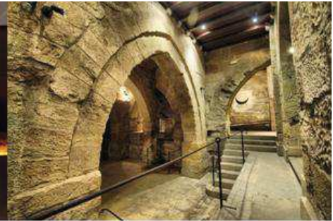
Sótano del Palacio de la Paeria

La Lleida Secreta tiene como objetivo la puesta en valor de las diferentes actuaciones arqueológicas que se han llevado a cabo en el centro histórico de la ciudad. Estos yacimientos permiten descubrir testimonios hasta ahora prácticamente desconocidos del pasado de Lleida.