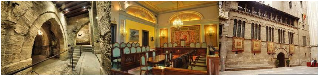
Soterrani de la Paeria