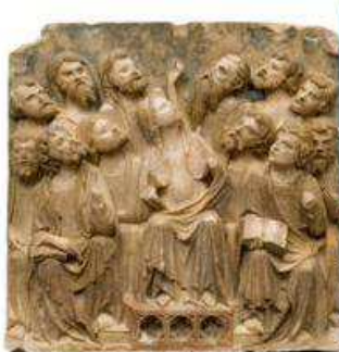
Relleu de Pentecostes – Altar major de la Seu Vella