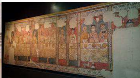
Pintura mural de la Pia Almoïna – Canonja Seu Vella

El Museu de Lleida, Diocesà i Comarcal, de 7000m 2 , és el gran referent museístic de Lleida i de la seva història. Pren la prehistòria com a punt de partida i arriba fins a l'era contemporània.