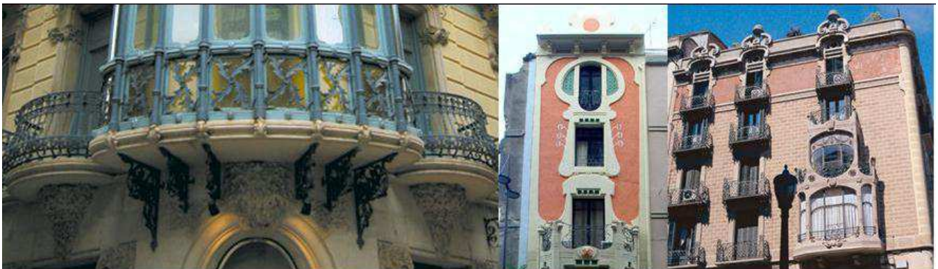
Casa Magí Llorens