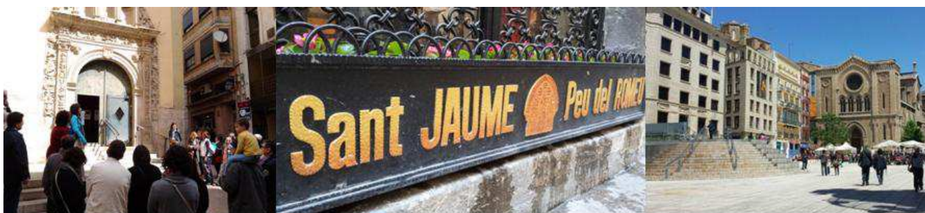
Façana exterior església de la Sang