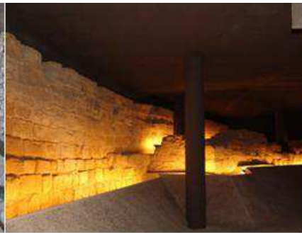
Restes muralla medieval Anselm Clavé