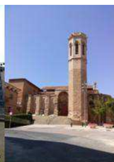
Església de Sant Llorenç