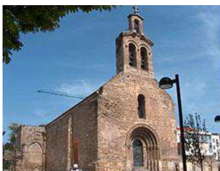
Església de Sant Martí