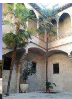
Antic Hospital de Santa Maria

Amb el carrer Cavallers - un dels vials amb més regust medieval de la ciutat - com a eix bàsic, es pot admirar edificis d'estil i usos molt diversos però de factura singular. Recorregut per la part medieval de la ciutat, on es dóna a conèixer els antics equipaments i la seva transformació actual.