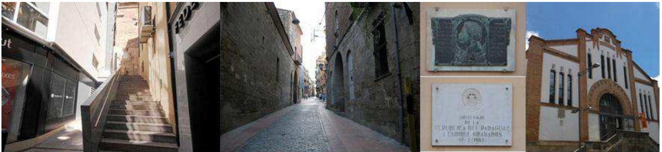
Costa del Jan