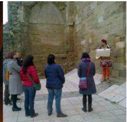
Exterior església Sant Martí

La ruta s'endinsa en la vida quotidiana de la Lleida medieval. On vivien el jueus? Com s'abastia d'aigua la població? Hi havia joglars a la ciutat? Com era l'Estudi General? I la Lleida de 1707? Una ruta amb inesperades sorpreses medievals.