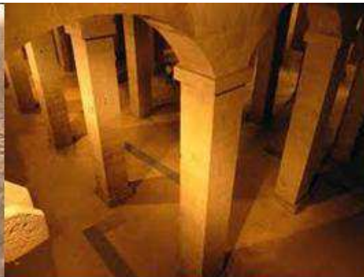
Dipòsit de l'Aigua