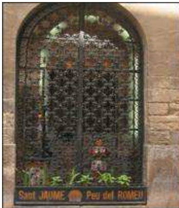
Peu del Romeu