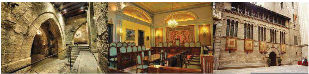
Soterrani de la Paeria