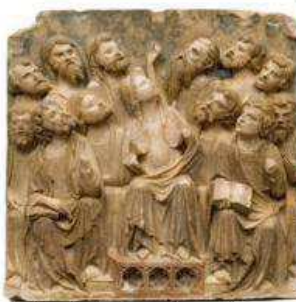
Relleu de Pentecostes – Altar major de la Seu Vella