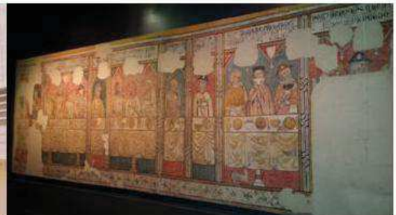
Pintura mural de la Pia Almoïna – Canonja Seu Vella

El Museu de Lleida, Diocesà i Comarcal, de 7000m 2 , és el gran referent museístic de Lleida i de la seva història. Pren la prehistòria com a punt de partida i arriba fins a l'era contemporània.