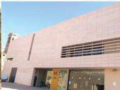
Vista exterior del Museu de Lleida