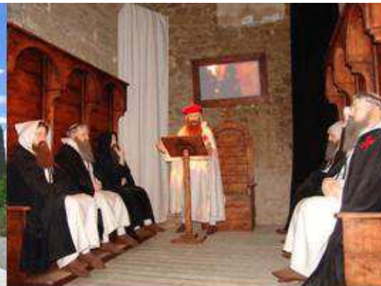
Monjos templers – Escena audiovisual