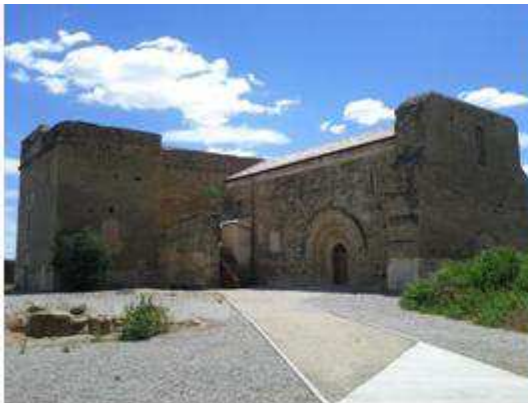
Vista panoràmica del Castell Templer de Gardeny