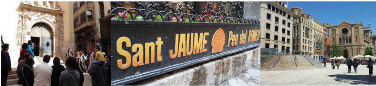
Façana exterior església de la Sang