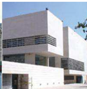
Vista exterior del Museu de Lleida