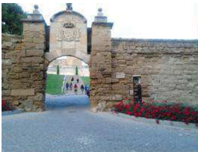
Porta del Lleó – Turó de la Seu Vella