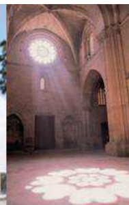
Interior església de la Seu Vella