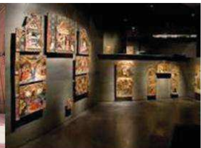
Interior Museu de Lleida

La ruta està formada per la visita a dos punts: