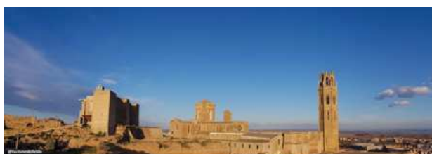
Vista exterior del Turó de la Seu Vella