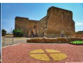
Castell Templer de Gardeny