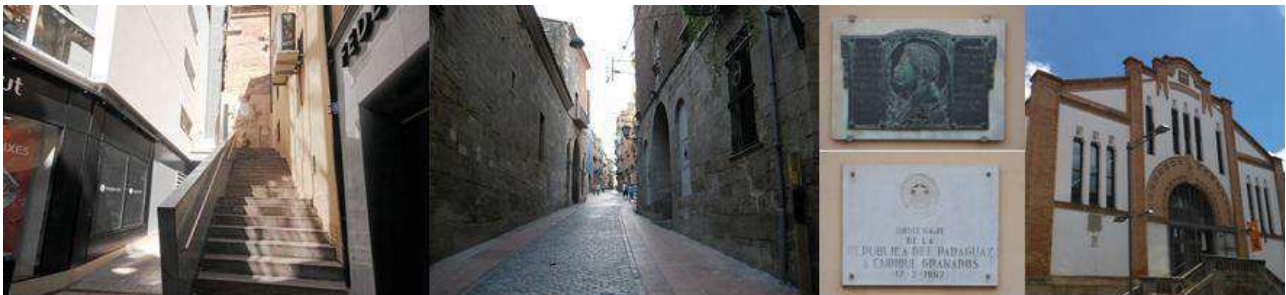
Costa del Jan