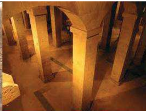
Dipòsit de l'Aigua