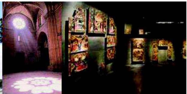
Interior església de la Seu Vella