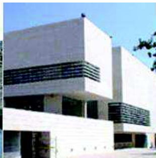
Vista exterior del Museu de Lleida