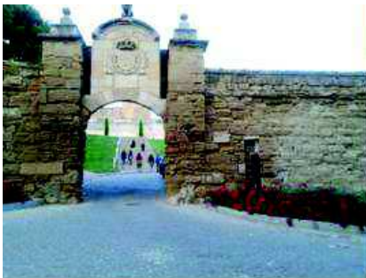
Porta del Lleó – Turó de la Seu Vella