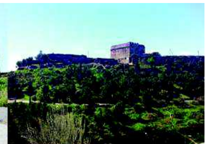
Vista exterior del Castell Templer de Gardeny

Quan algú s'acosta a Lleida per qualsevol de les seves vies d'accés, el primer que hi veu és la Seu Vella, dalt del turó, el més alt, dels dos que caracteritzen la línia d'horitzó de la ciutat. L'altre turó, el de Gardeny constitueix una part important en la història de Lleida. Tots dos turons, juntament amb el riu Segre, emmarquen la ciutat antiga, construïda a l'entorn del turó de la Seu, emmurallada fins a mitjans del segle XIX.