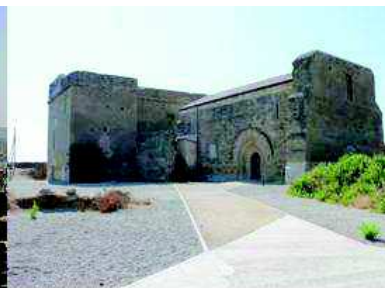
Castell Templer de Gardeny