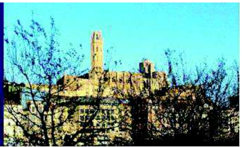
Vista panoràmica de la Seu Vella

La Seu Vella és l'edifici més destacat del conjunt monumental, i el monument amb el qual, sens dubte, s'identifica la ciutat de Lleida. La Seu Vella és la catedral antiga de Lleida i està formada pels diferents espais que en el seu moment constituïen la catedral: l'església amb les seves capelles, el claustre, el campanar i la canonja. Va ser construïda en època medieval i durant uns cinc-cents anys va ser la catedral de Lleida. L'any 1707, en el marc de la guerra de Successió, fou tancada al culte per ordre de Felip V i poc després transformada en caserna militar.