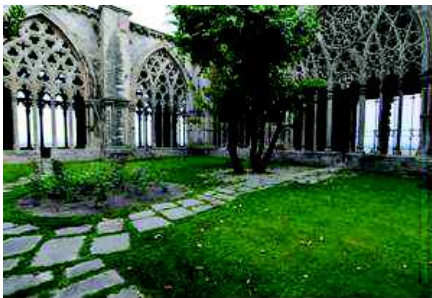
Claustre del s. XIV