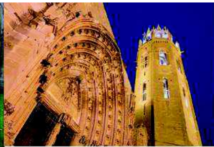
Porta dels Apostols i campanar del s. XV